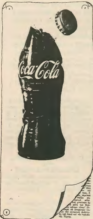
Η πίσω σελίδα της σ.ε. φύλλο... 197. Τα «ΝΕΑ» απαγόρευαν την εμφάνιση ενός κριτικού άρθρου πάνω στη θεατρική ζωή στον τόπο και οι σύντροφοι σ' ένδειξη διαμαρτυρίας κάλυψαν την πίσω σελίδα με μια σπασμένη μπουκάλια της Κόκα-Κόλα. Κάτω από την φωτογραφία φαίνονται οι τελευταίες προτάσεις του λογοκριμένου άρθρου.

Η κηδεία του Δώρου μετατράπηκε σε μια δυναμική διαδήλωση. Η δολοφονία του Δ. συγκλόνισε όχι μόνο τους συντρόφους του αλλά είχε αντίκτυπο σ' ολόκληρο τον Κυπριακό λαό. Πάνω από τα φέρετρό του, οι σύντροφοι του έδιναν την α-